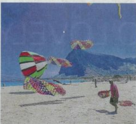
Il Festival degli Aquiloni, uno dei tradizionali appuntamenti di San Vito Lo Capo

«Di una struttura, nella zona del porto, dove il visitatore avrà la possibilità di poter degustare il pesce fresco appena sbarcato dai pe-